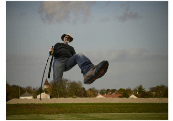
« Visions d'artistes »